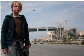
da Corpo celeste

Arriva nei cinema venerdì 27 Corpo celeste di Alice Rohrwacher . Riconosciuto di interesse culturale con il contributo della direzione generale per il Cinema, il film ha avuto il battesimo in sala nella selezione della Quinzaine des Réalisateurs nel 64 esimo Festival di Cannes. La tredicenne Marta, dopo dieci anni con la famiglia in Svizzera, torna a vivere in Italia, a Reggio Calabria. Esile, attenta e inquieta, al suo sguardo magico e profondo nulla sfugge, né dei luoghi, né delle persone. Nel sito internet della direzione generale per il cinema, un trailer del film, dal canale YouTube Cinemamibac. Notizie del film nel sito internet www.tempestaofilm.it .